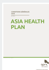
VOS CONDITIONS GÉNÉRALES DÉTAILLANT LE FONCTIONNEMENT DE VOTRE CONTRAT,