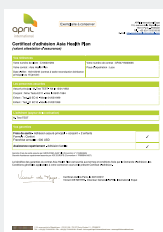
VOTRE CERTIFICAT D'ADHÉSION VALANT ATTESTATION D'ASSURANCE,